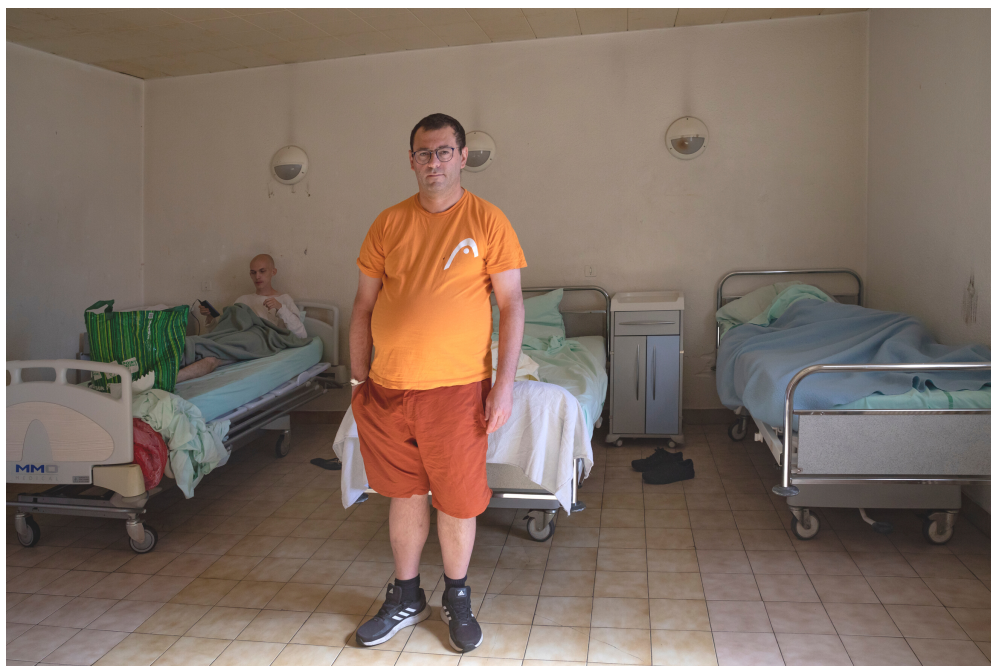
Chambre de patient