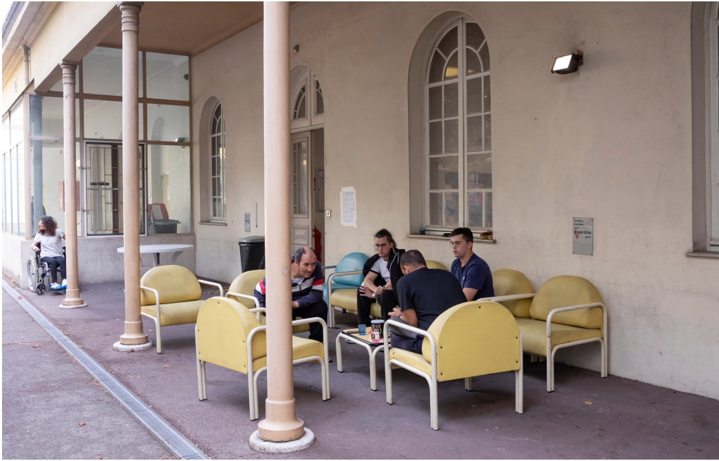
Terrasse de Saint-Lazare Unité ouverte de psychiatrie générale