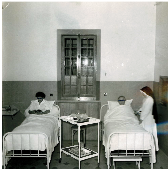
Dortoir - 1955 -