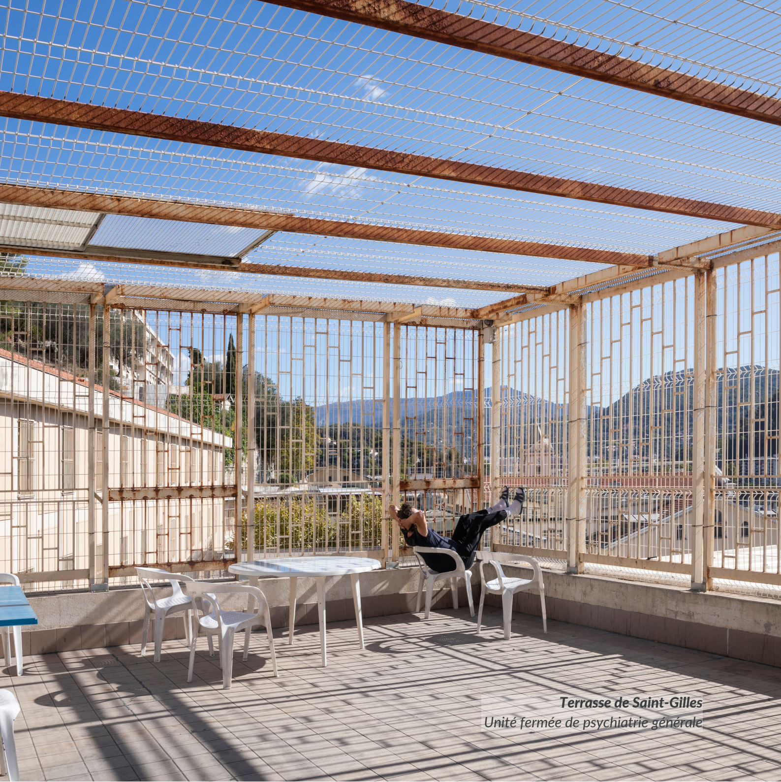
Terrasse de Saint-Gilles Unité fermée de psychiatrie générale