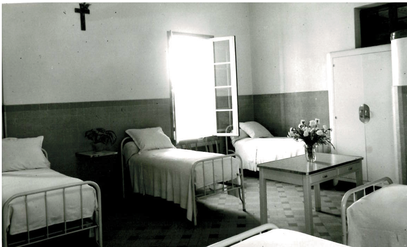
Dortoir - 1955 -