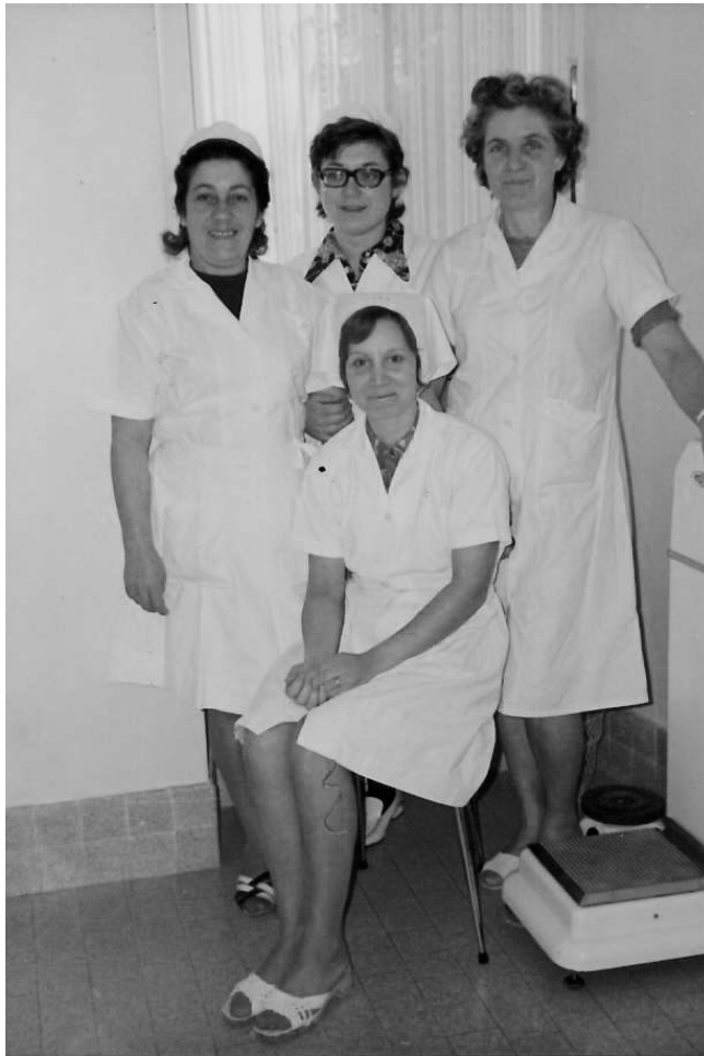
Des générations dédiées à l'accompagnement des patients - Années 60 -