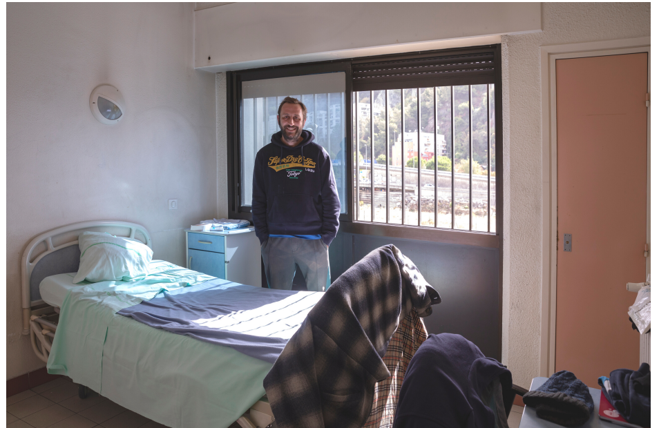
Chambre de patient