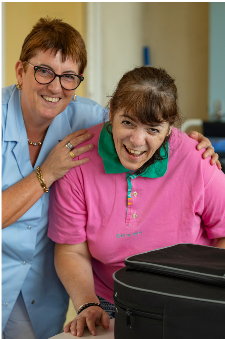
Saint-Pierre Unité ouverte de psychiatrie générale