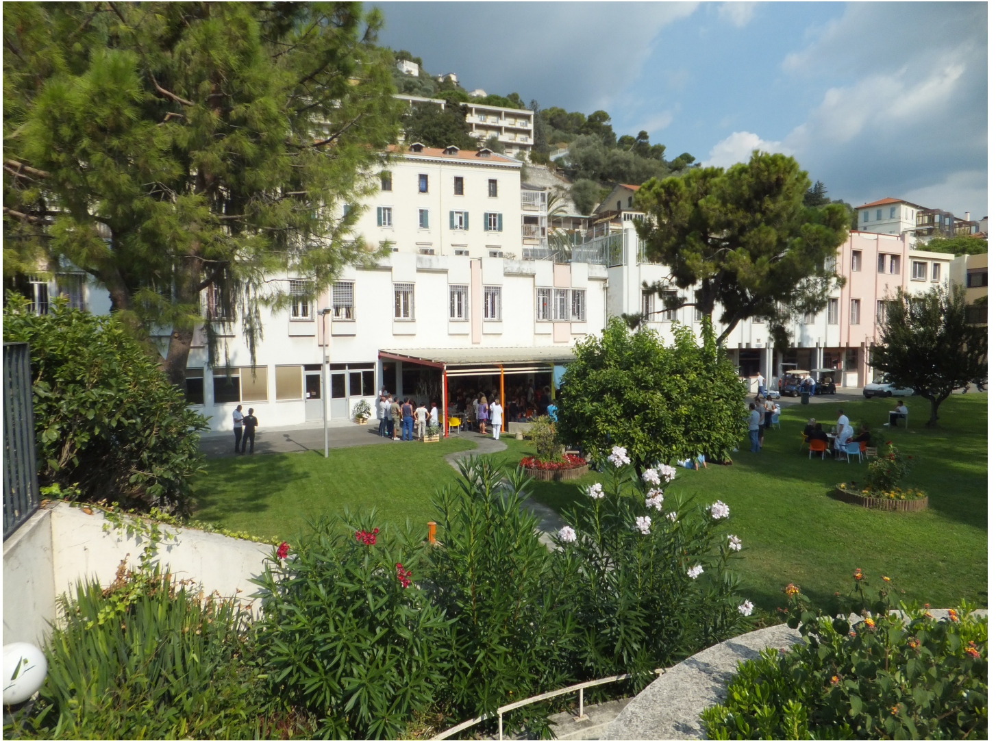
Caf t ria - Jardin central - 2015 -