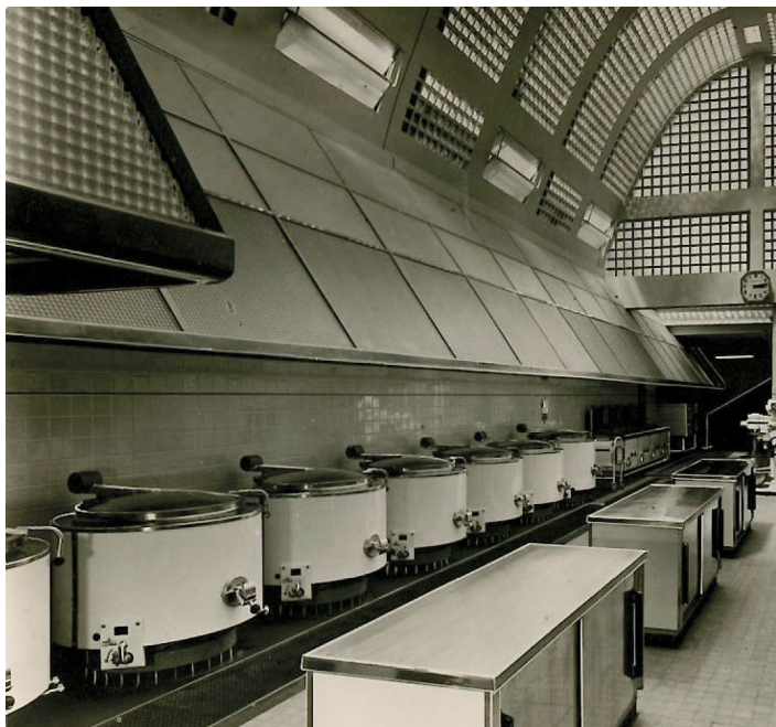
Cuisine centrale - 1955 -