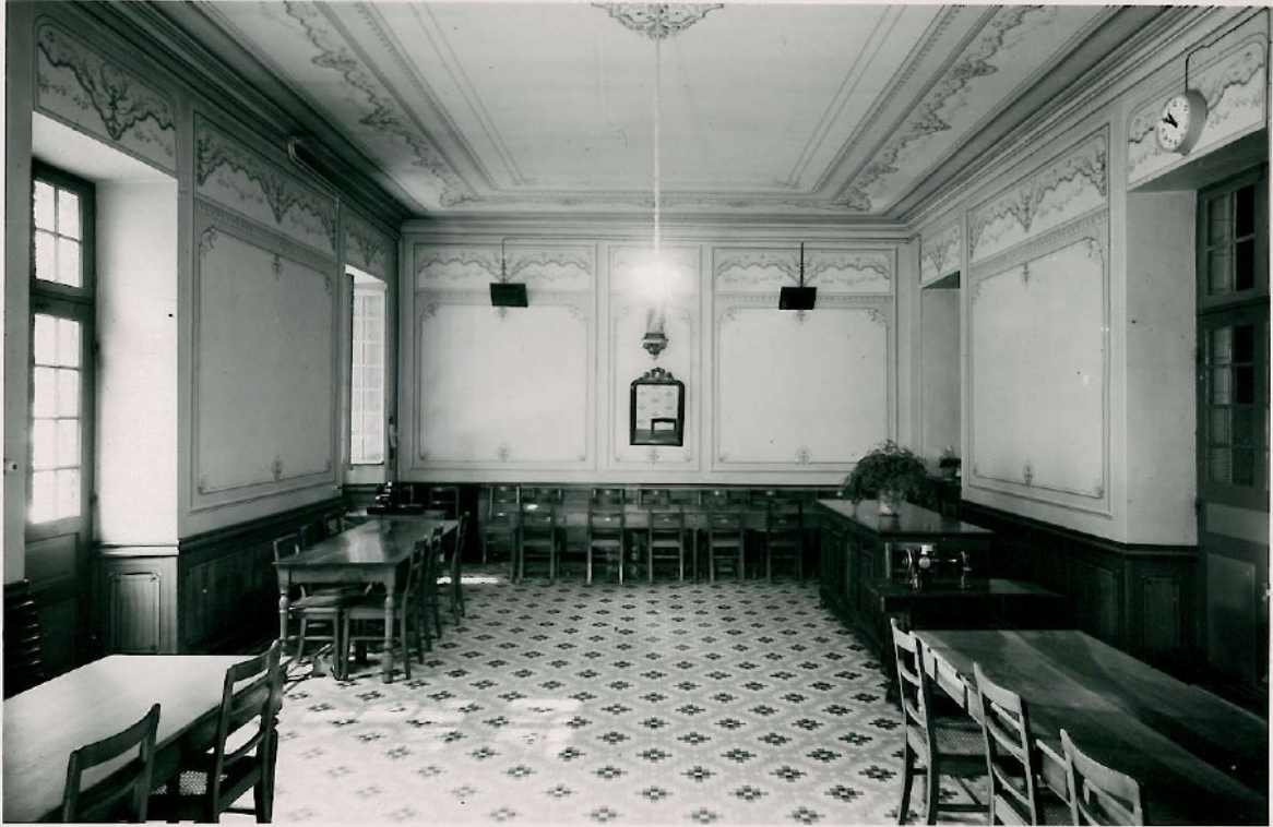
1ère DIVISION : SALLE DE JOUR