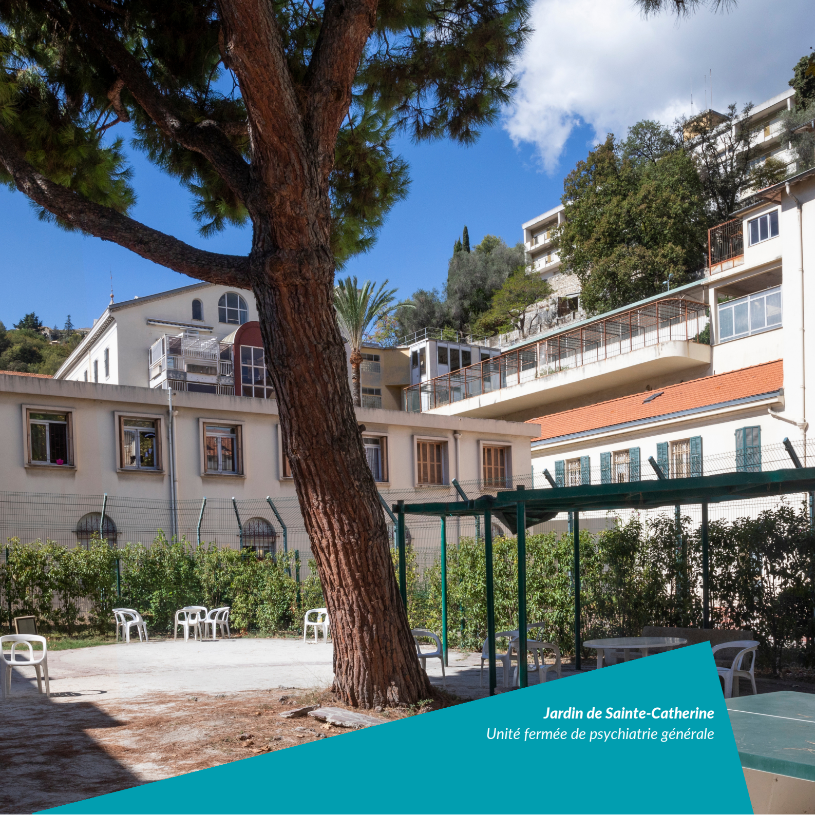
Jardin de Sainte-Catherine Unité fermée de psychiatrie générale