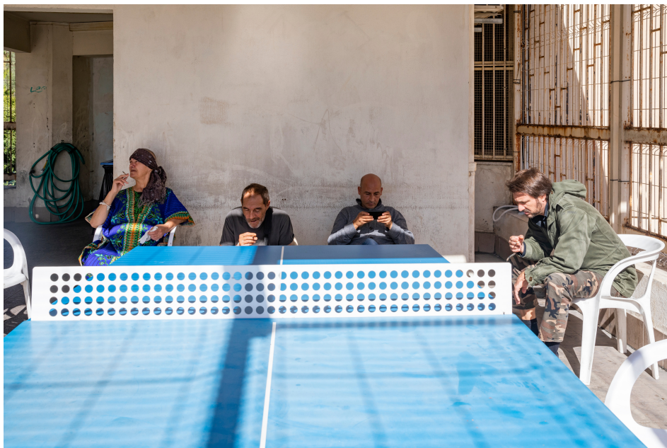
Terrasse de Saint-Gilles Unité fermée de psychiatrie générale