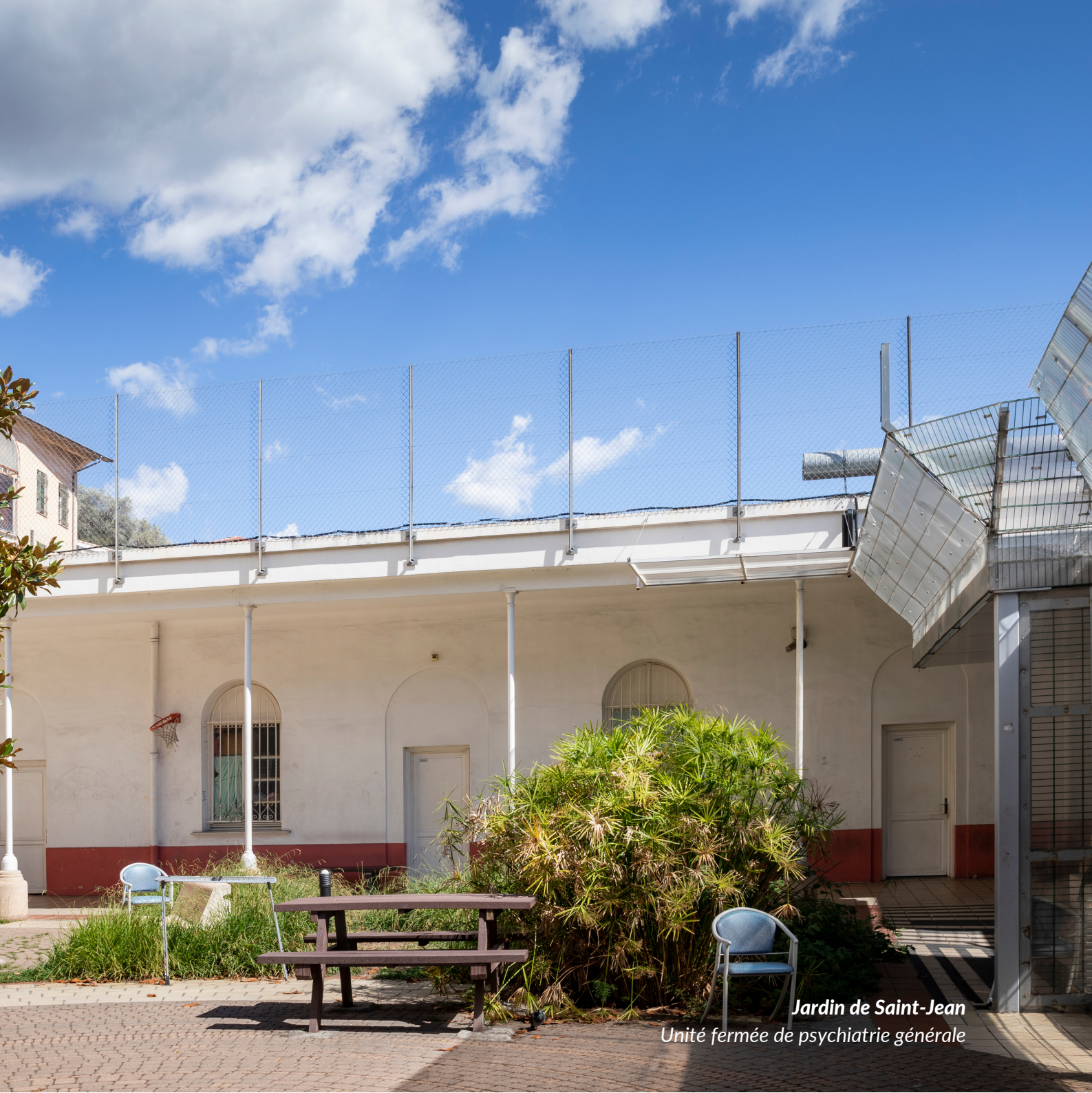
Jardin de Saint-Jean Unité fermée de psychiatrie générale