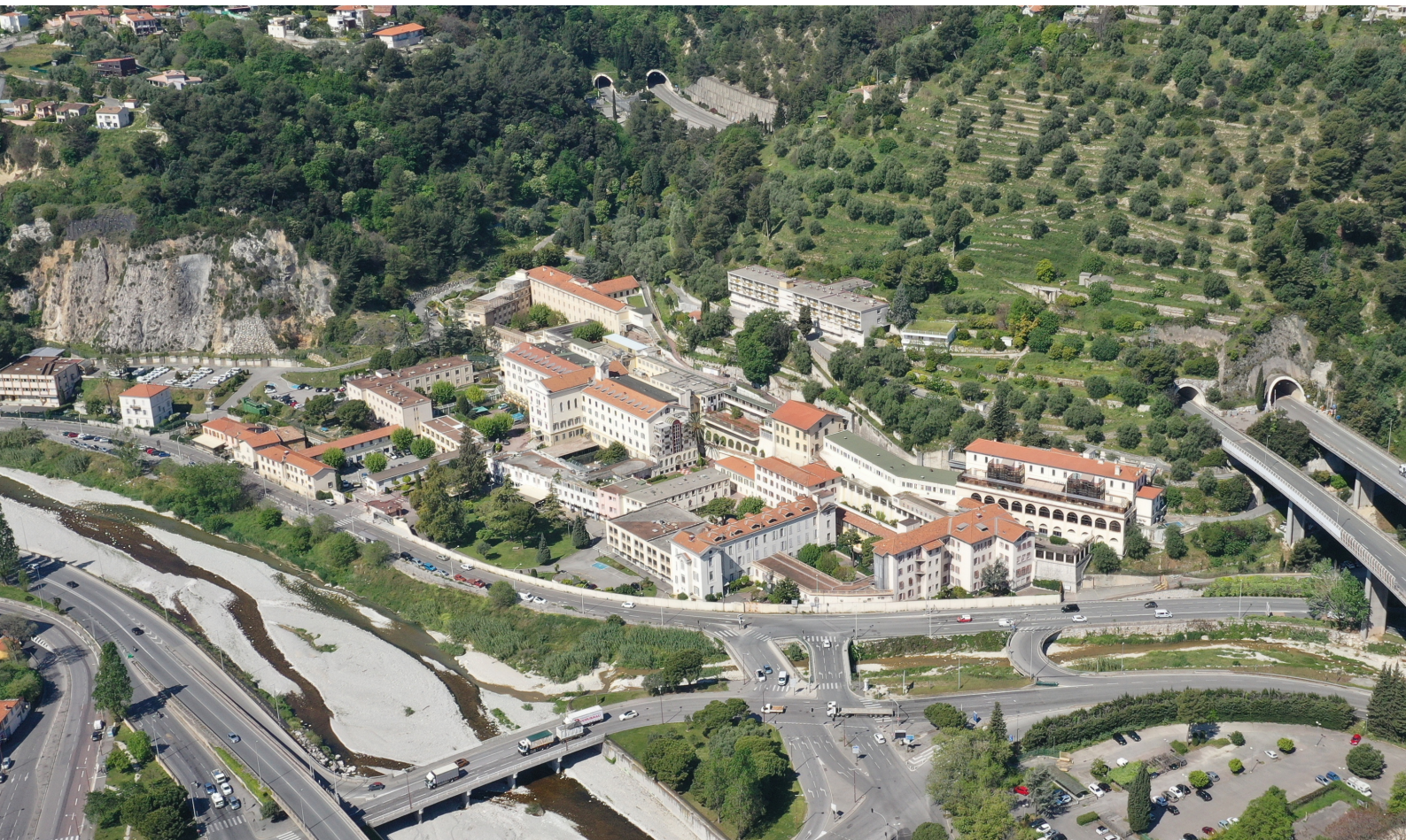
Vue aérienne du site