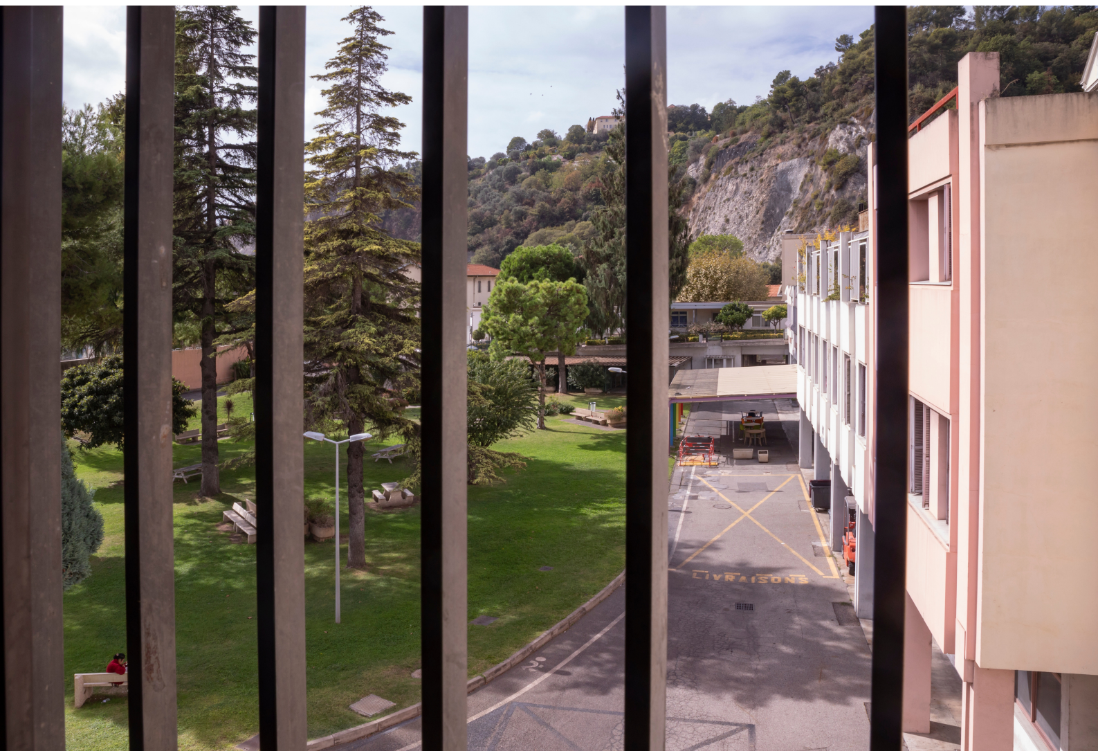
Vue de Sainte-Thérèse sur le jardin central Unité ouverte de psychiatrie générale