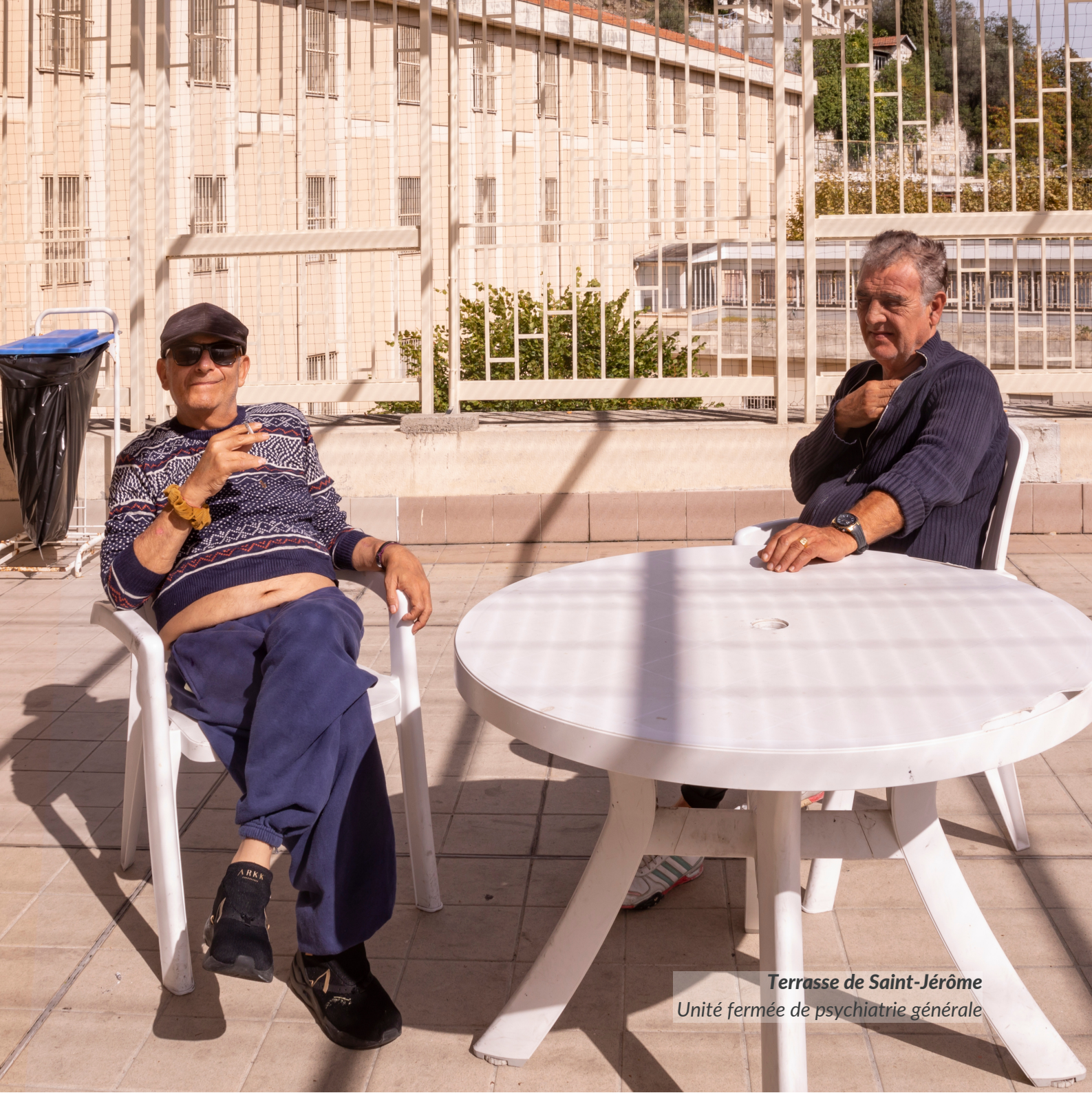
Terrasse de Saint-Jérôme Unité fermée de psychiatrie générale