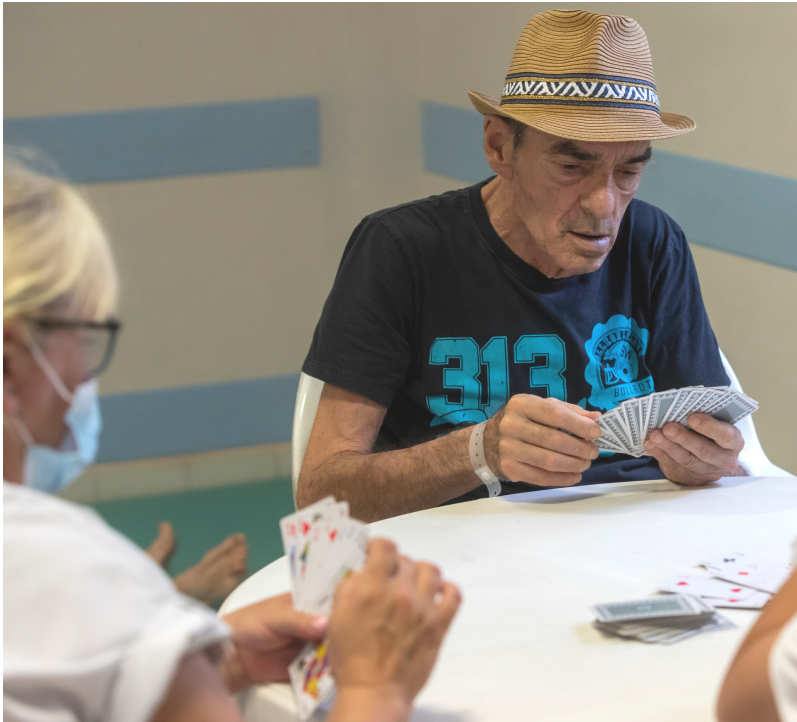
Saint-Gabriel Unité de soins psychiatriques du sujet âgé