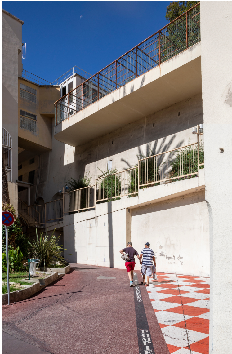
Montée de la cuisine