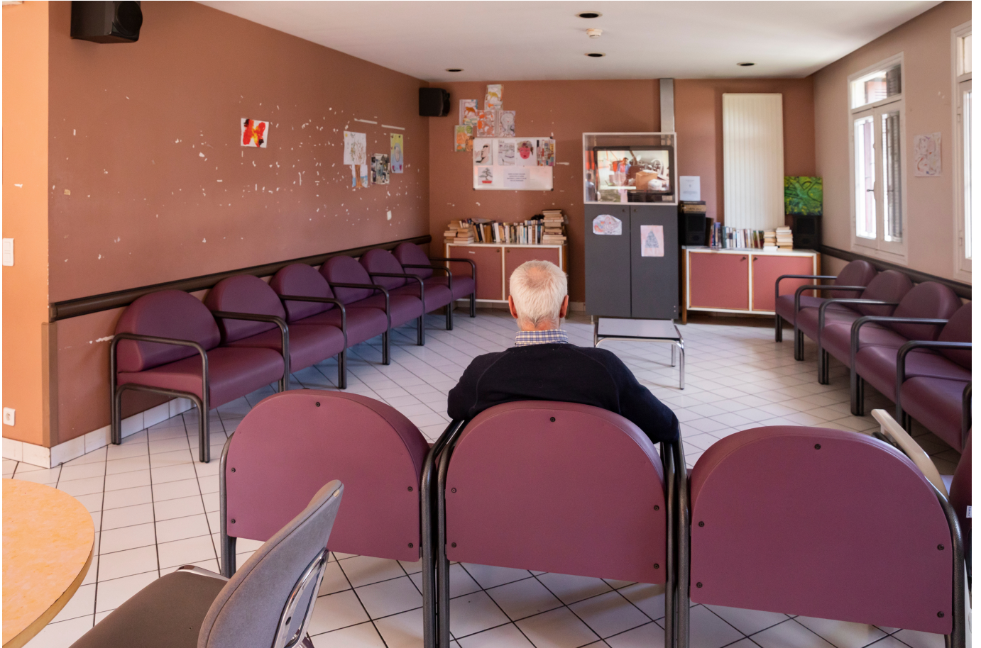
Sainte-Lucie Unité ouverte de psychiatrie générale