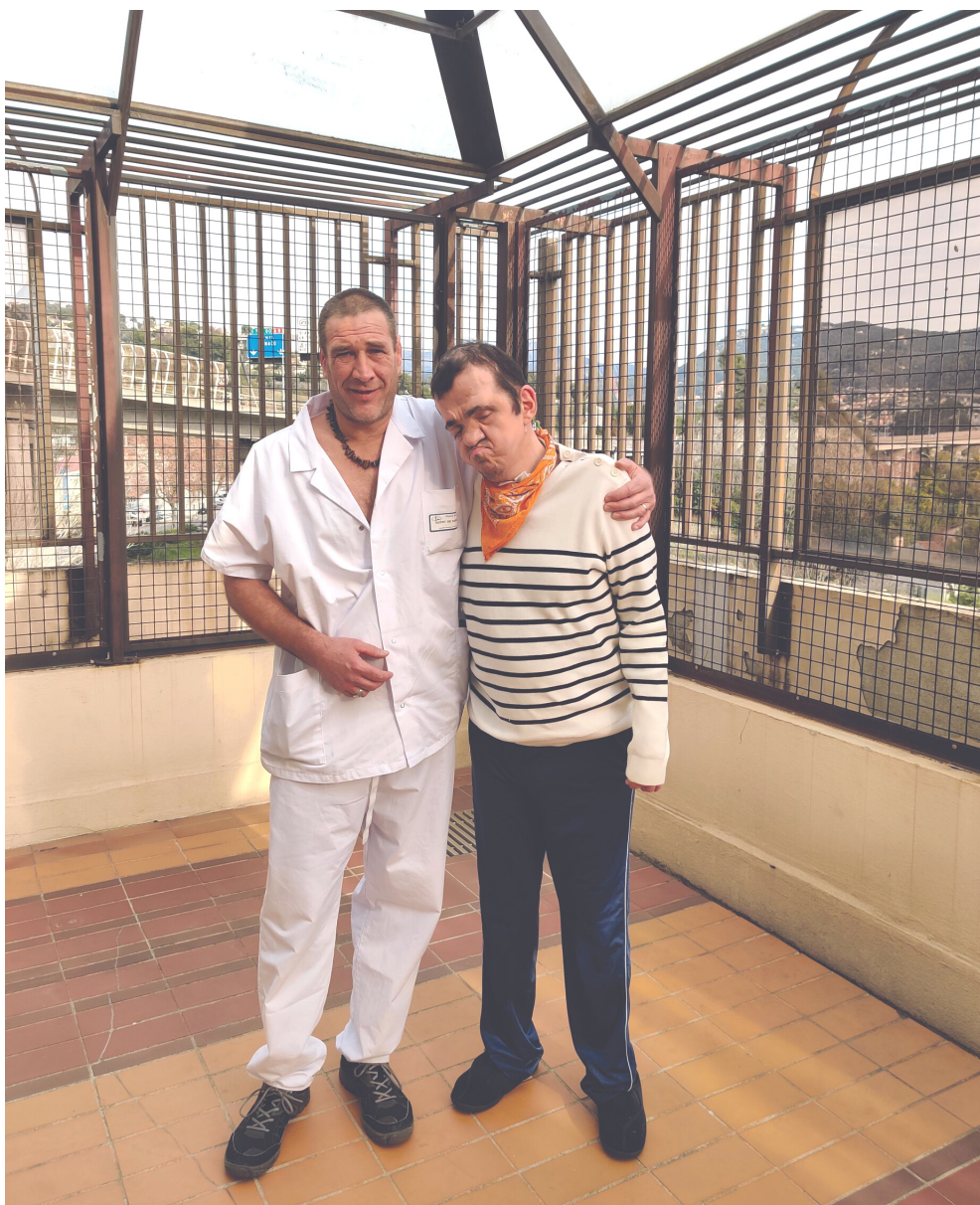
Sainte-Rita Clinique des autistes