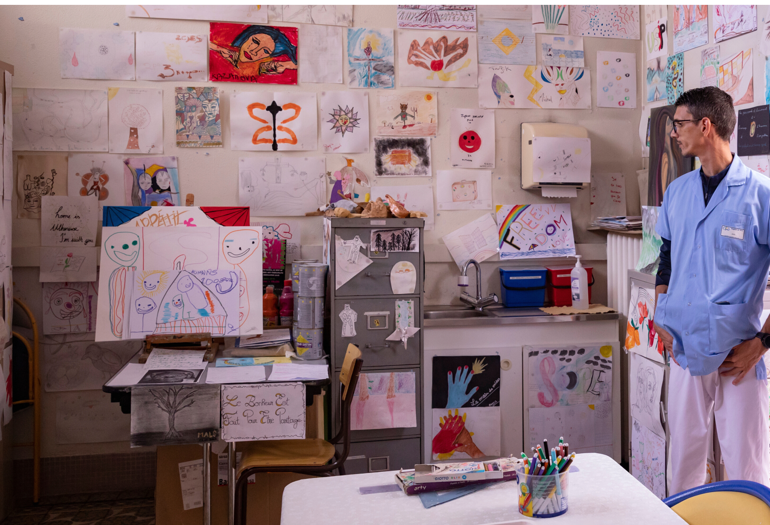
Unité de Soins Intensifs Psychiatriques Atelier d'art-thérapie