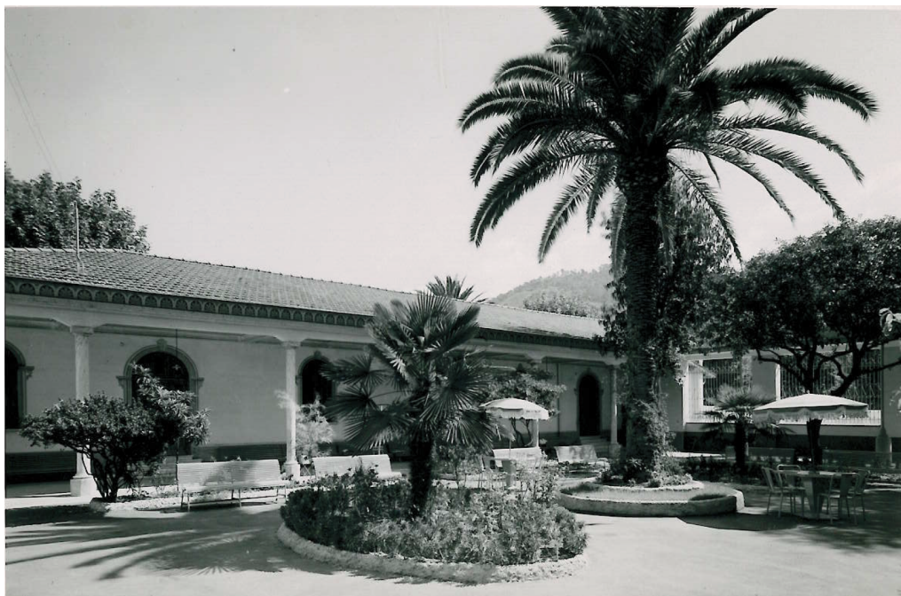
Jardin Providence - 1955 -