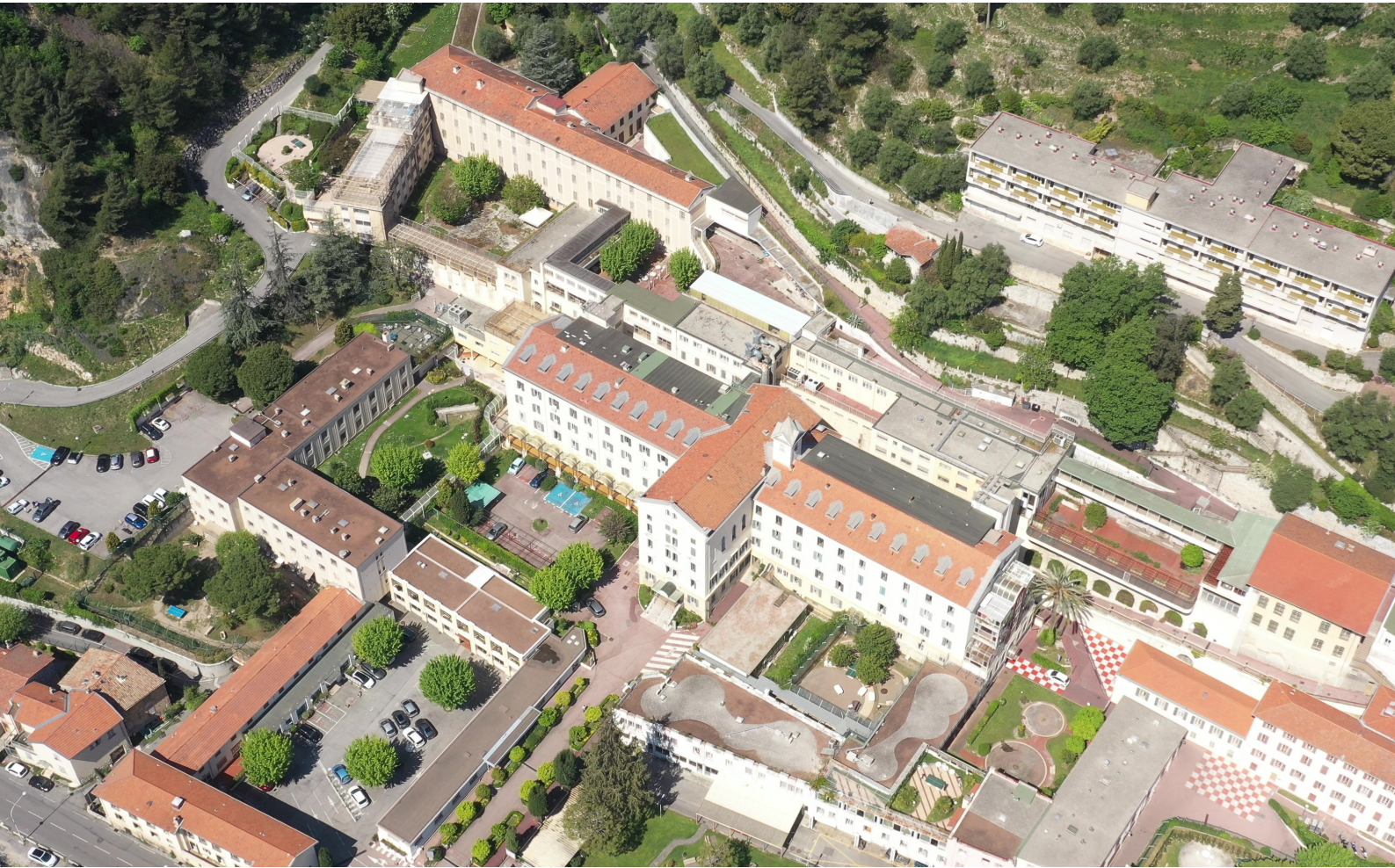
Vue aérienne du site