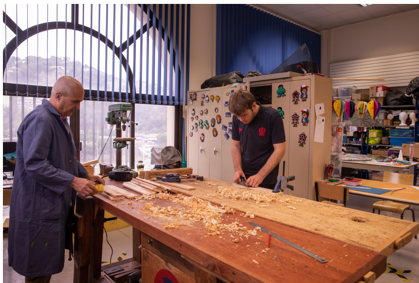
Atelier Thérapeutique Polyvalent