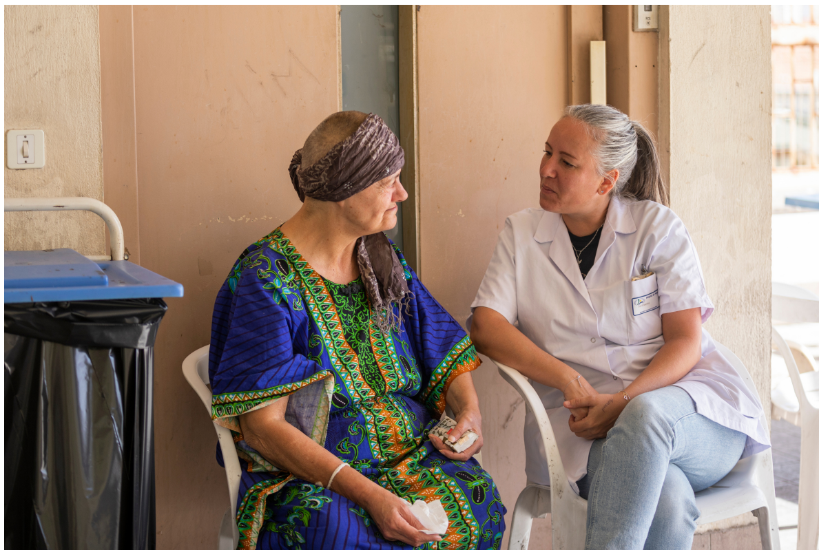
Terrasse de Saint-Gilles Unité fermée de psychiatrie générale