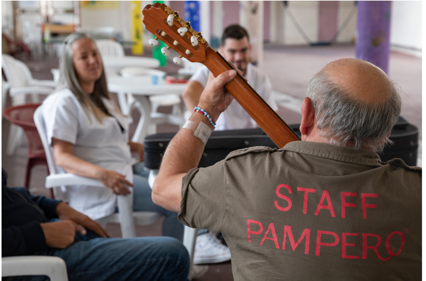
Saint-Pierre Unité ouverte de psychiatrie générale