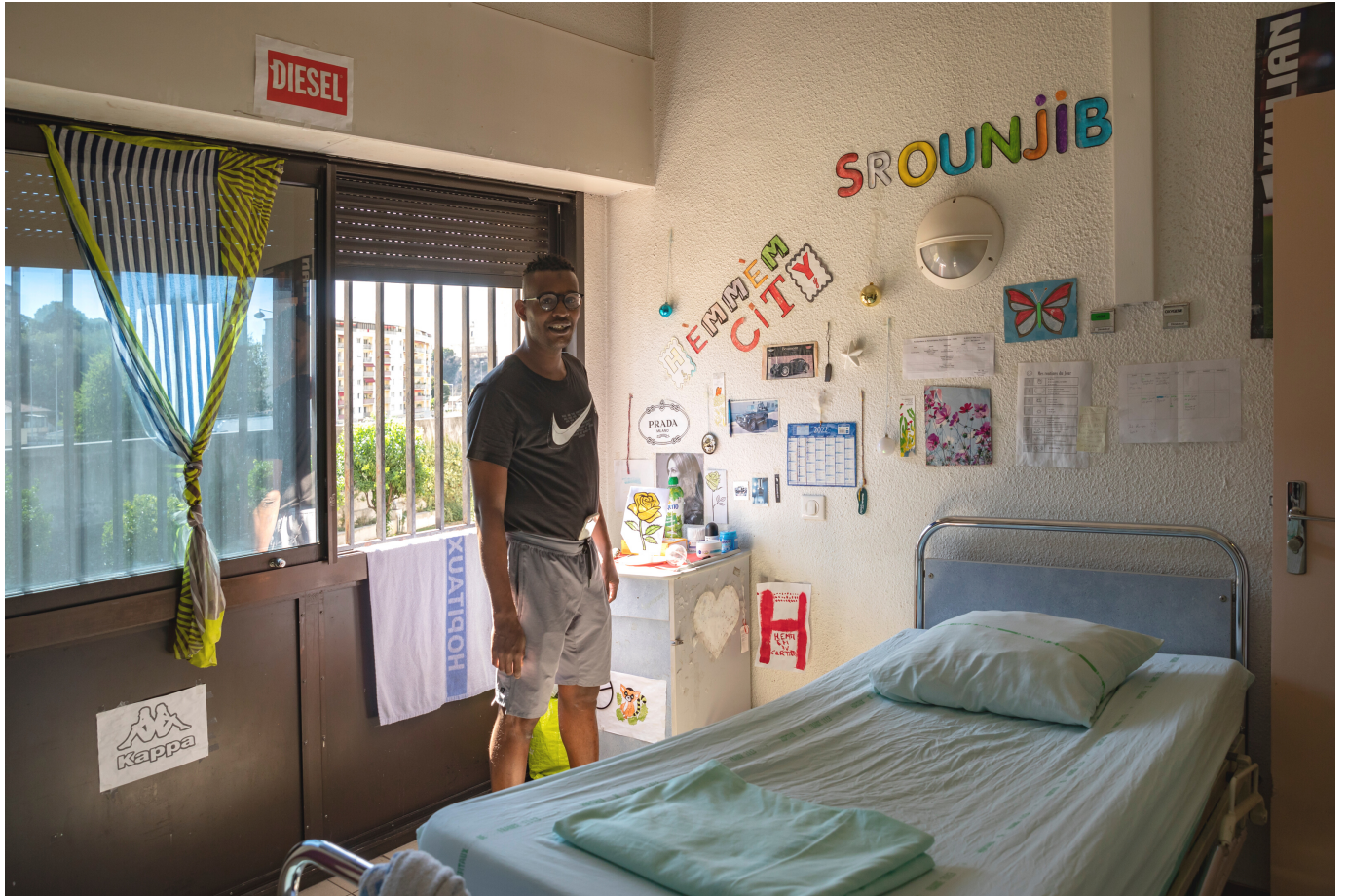
Chambre de patient