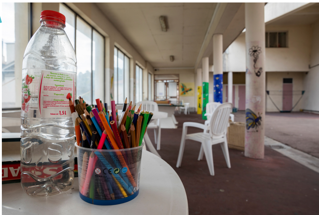
Terrasse de Saint-Pierre Unité ouverte de psychiatrie générale