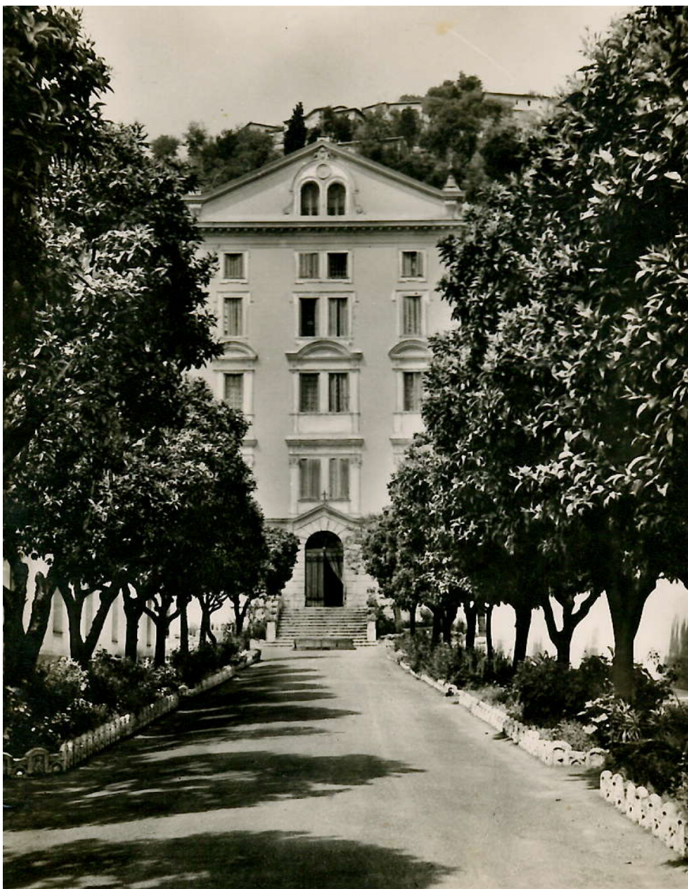
L'entrée emblématique du Centre Hospitalier Sainte-Marie Nice - 1955 -