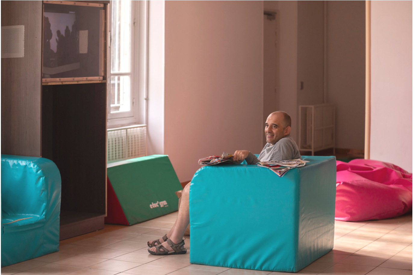
Sainte-Rita Clinique des artistes